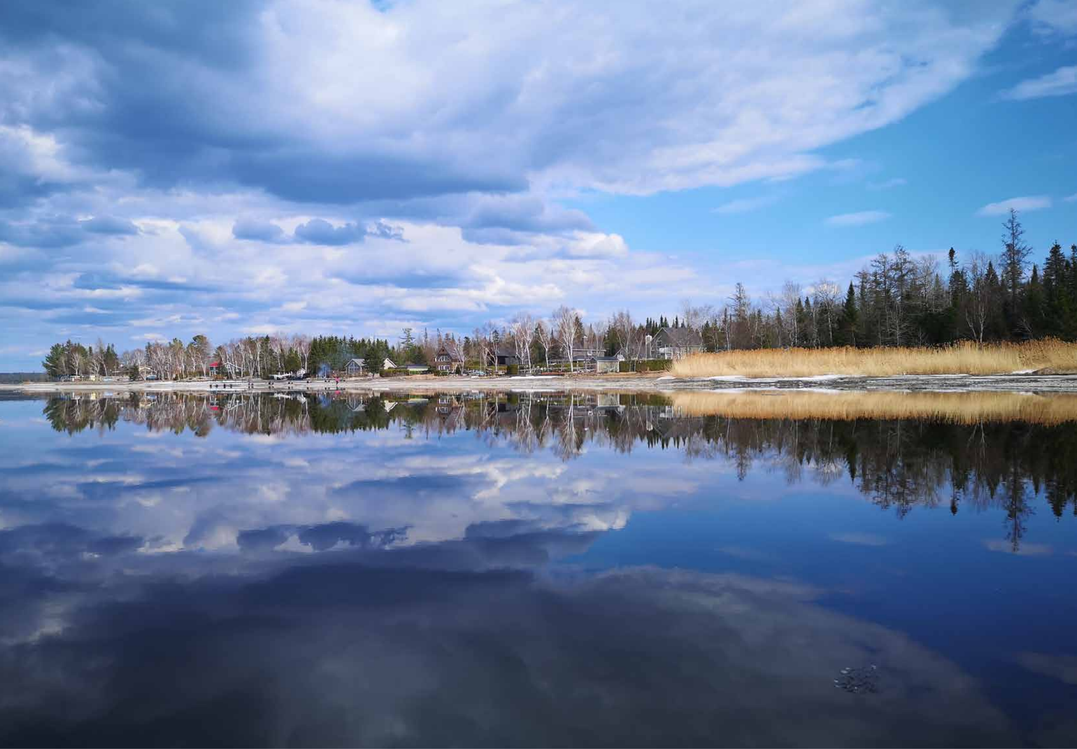
Le Grand Lac en avril