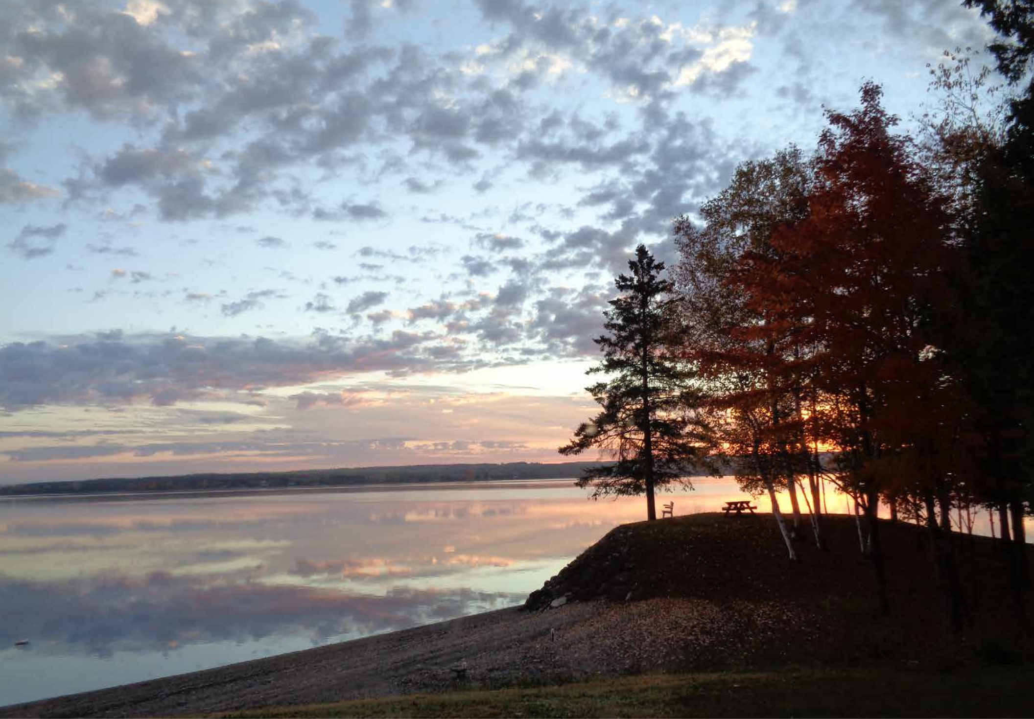
Levée de soleil sur le Grand Lac en automne (Mme Nicole Gracia gagnante du 3e prix dans le cadre du concours de photo des paysages représentant municipalité de Sainte-Praxède.)