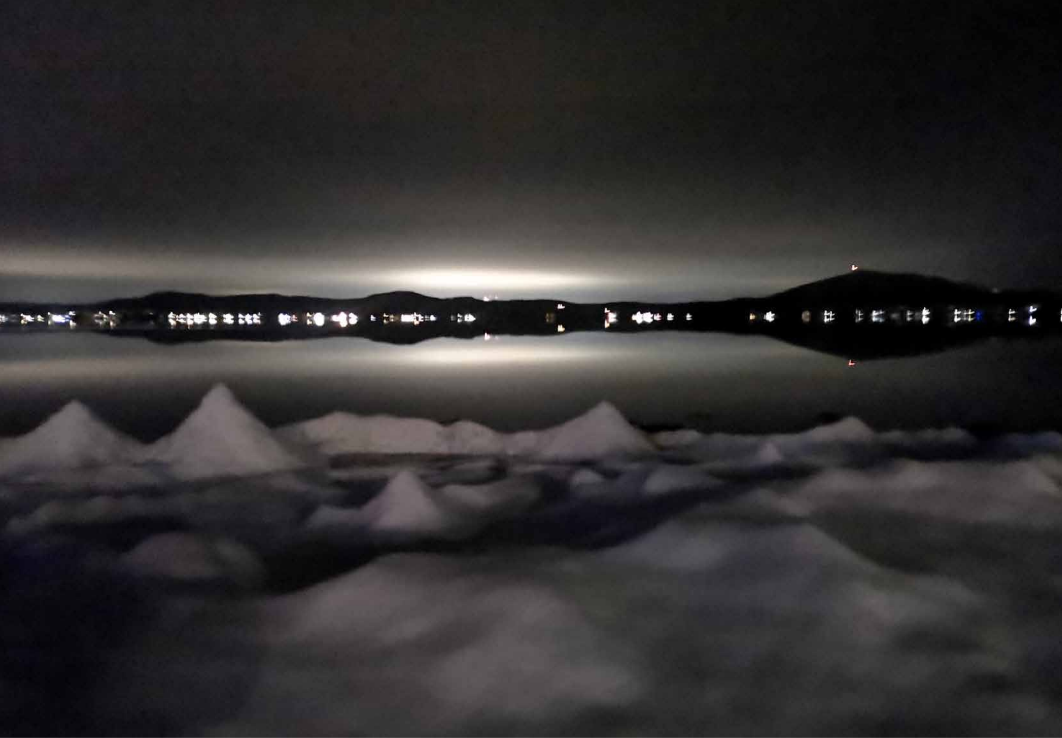
Grand Lac St-François en décembre avec en arrière-plan le mont Adstock (M. Guy Vallée gagnant du 2e prix dans le cadre du concours de photo des paysages représentant municipalité de Sainte-Praxède.)